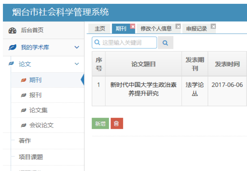
图 5 成果栏目

在我的学术库内找到需要申报的成果（只能申报一项），在操作栏目内点击申报社科奖按钮进行申报。如需要更改申报信息，请点修改按钮。