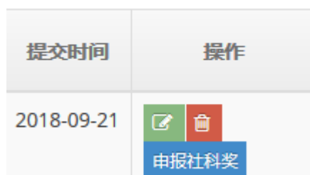
图 6 操作栏目