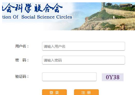
图 1 登录页面

请登录烟台市社会科学管理系统进行个人账户注册，网址为： http://219.231.223.76/ytsk/login ，认真填写个人相关信息。如在密码丢失，请和本单位管理员联系进行修改。