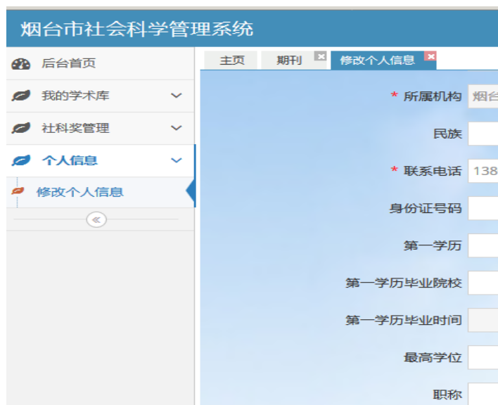
图 3 修改个人信息页面