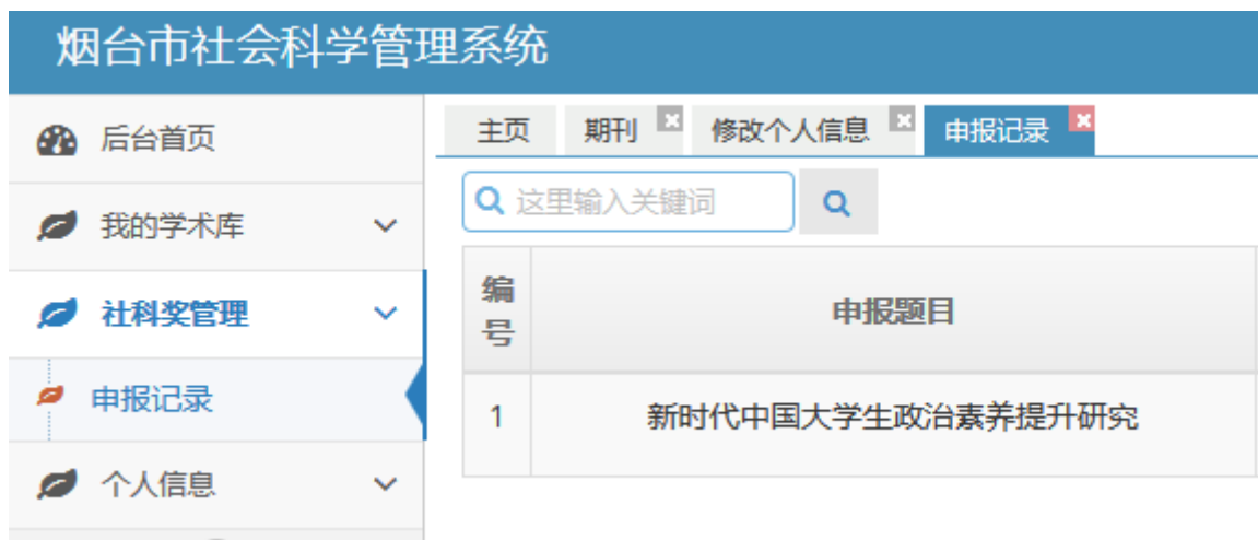
图 8 申报记录栏目

通过审核的成果，在申报记录页面会自动生成《申报信息卡》、《烟台市社会科学优秀成果奖评选表》。请在操作栏目点击下载按钮下载后进行打印。